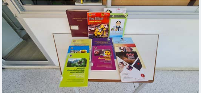
รูปที่ ๒.๒๗.๑ หนังสือ ตำรา หรือมาตรฐานเกี่ยวกับความปลอดภัย อาชีวอนามัย และสภาพแวดล้อมในการทำงาน ในห้องสมุดของสถาบันฯ