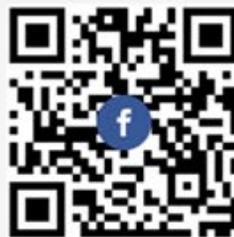
รูปที่ ๒.๒๗.๓ ข้อมูลที่เกี่ยวกับความปลอดภัยผ่าน Facebook ชื่อ IL Physical System & Environment ของทางสถาบัน ฯ

QR CODE เข้า Facebook ชื่อ IL Physical System & Environment