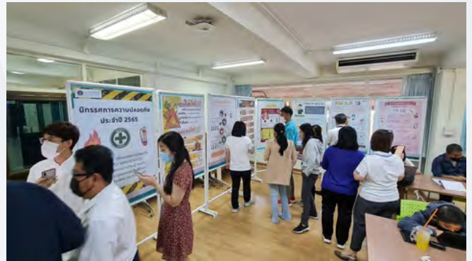
๒.๗.๑ บอร์ดให้ความรู้เกี่ยวกับการปฐมพยาบาลเบื้องต้น