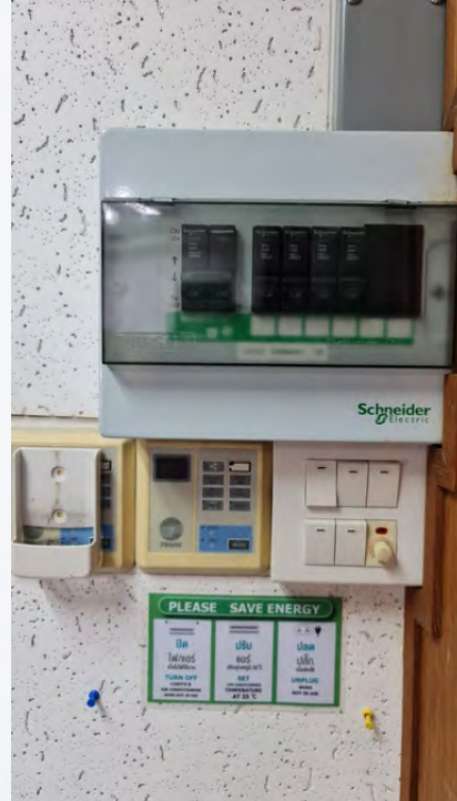
รูปที่ ๒.๑๑ แสดงตู้เบรกเกอร์หลักและย่อยในอาคารสถาบันนวัตกรรมการเรียนรู้