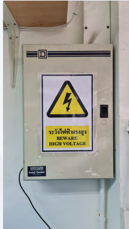
รูปที่ ๒.๑๒ แสดงตู้เบรกเกอร์หลักและย่อยในอาคารศูนย์วิจัย