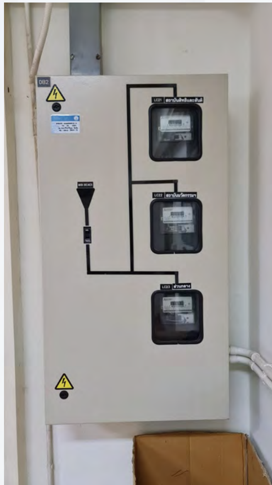
รูปที่ ๒.๑๓ แสดงตู้เบรกเกอร์หลักในอาคารปัญญาพิพัฒน์