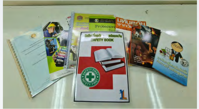
รูปที่ ๒.๒๗.๑ หนังสือ ตำรา หรือมาตรฐานเกี่ยวกับความปลอดภัย อาชีวอนามัย และสภาพแวดล้อมในการทำงาน ในห้องสมุดของสถาบันฯ